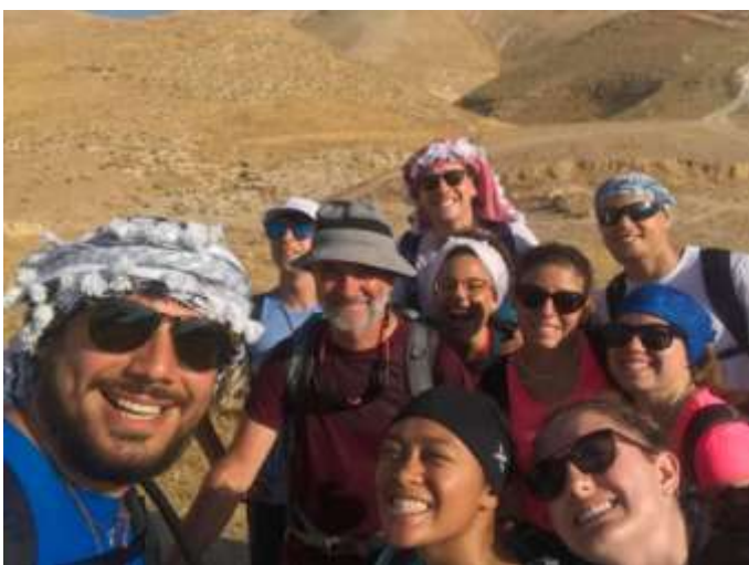
2019 – Terra Santa, gruppo giovani