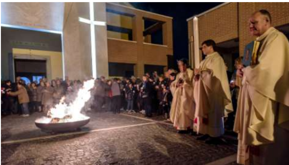
2016 Veglia pasquale