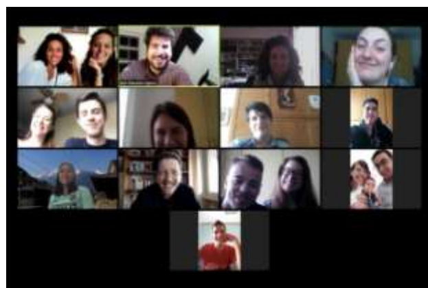
2020 – Pasqua online Causa Covid