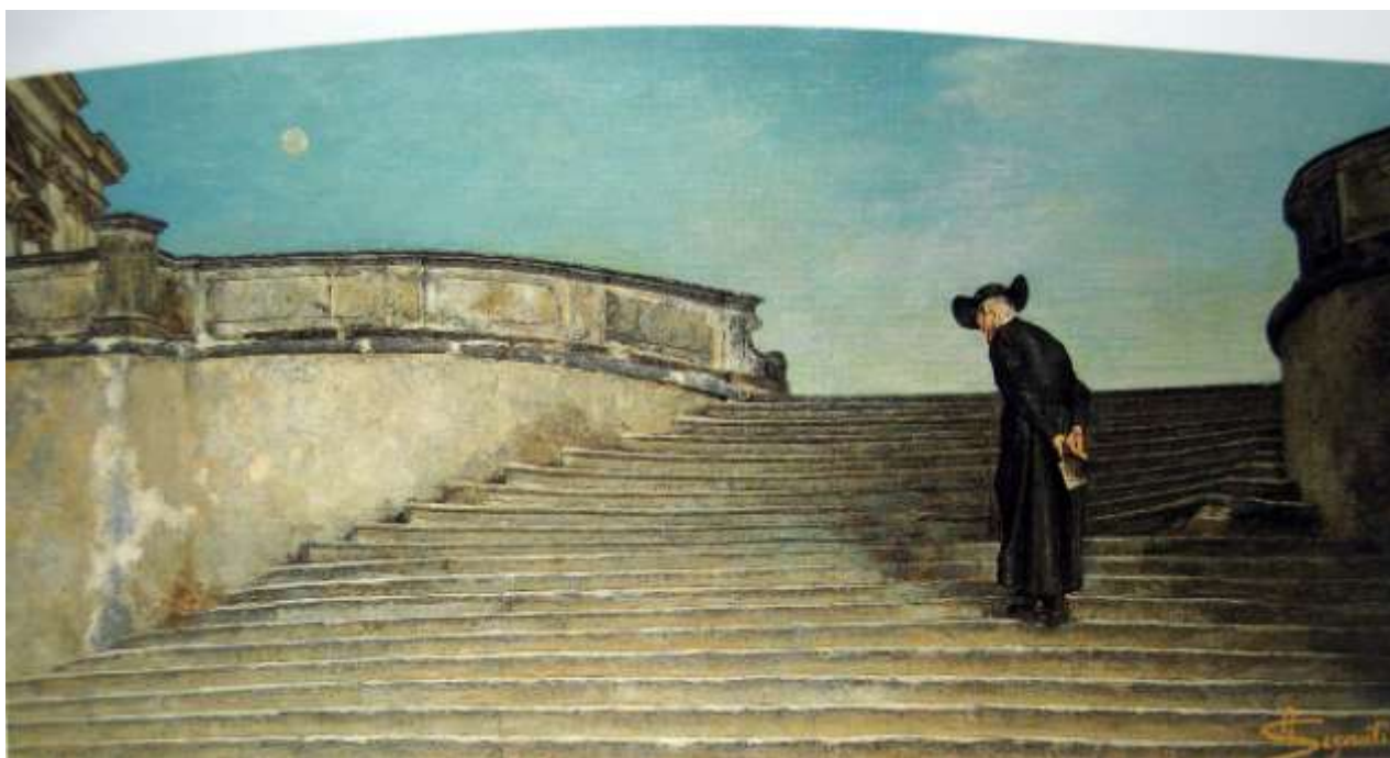
A messa prima – Giovanni Segantini - 1884

La partenza di un prete e l'arrivo di un nuovo giovane presbitero sono l'occasione per una breve riflessione su cosa significhi, oggi, diventare preti a Milano, in una città come la nostra. Una sfida non facile. Per carità, non che sia facile costruire un rapporto di coppia, diventare genitori ecc... e di farlo da credenti! Ma qui vogliamo riflettere sulla peculiarità della sfida di una vocazione come quella del prete, nella convinzione che poi, la riflessione porti qualche apporto alla vita di tutti. Il prete non è un marziano, non vive in un mondo "altro", nelle nuvole, vive la vita comune, pur con un suo cammino specifico, una sua vocazione. Un cammino, quello del prete, che chiede che la sua umanità venga plasmata dall'incontro con il Signore, e nel diventare discepolo impari anche a diventare uomo.