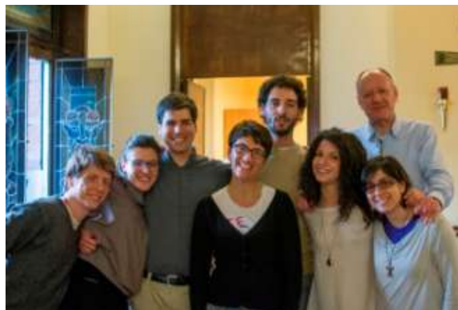
2013 – Veglia Vangelo