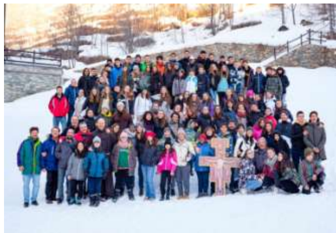
2019 – Campo estivo medie e campo invernale