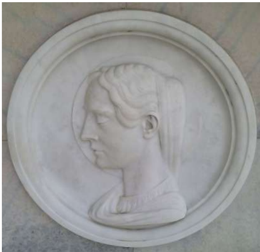
Santa Crescenza in un busto a bassorilievo presso la Basilica di San Martino di Magenta dove si trova oggi il suo corpo