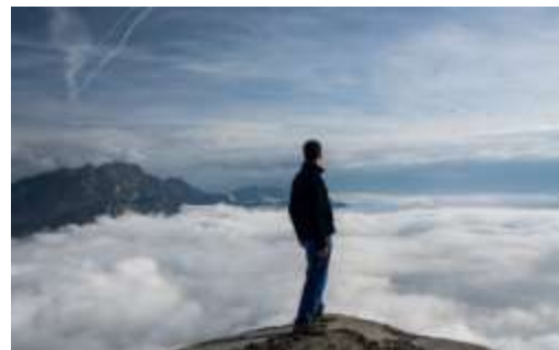
2013 Pian dei Resinelli con adolescenti