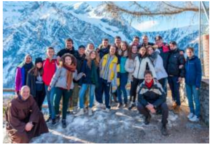
2018 – Ritiro adolescenti ad Assisi e campo invernale