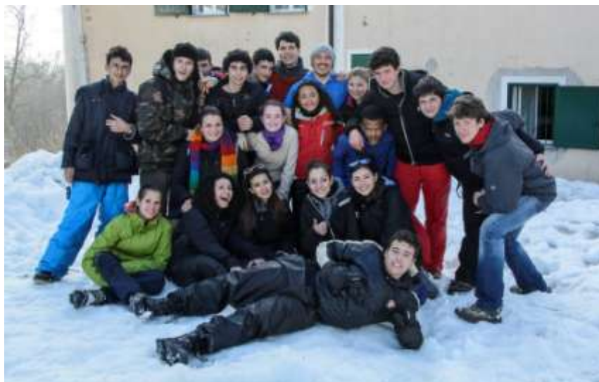
2014 Pian dei Resinelli con adolescenti