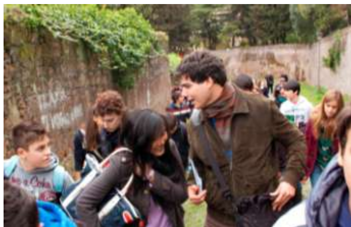
2013 – Ritiro medie a Roma