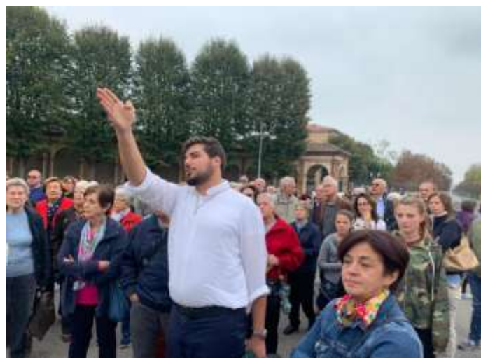
2019 – Pellegrinaggio a Caravaggio