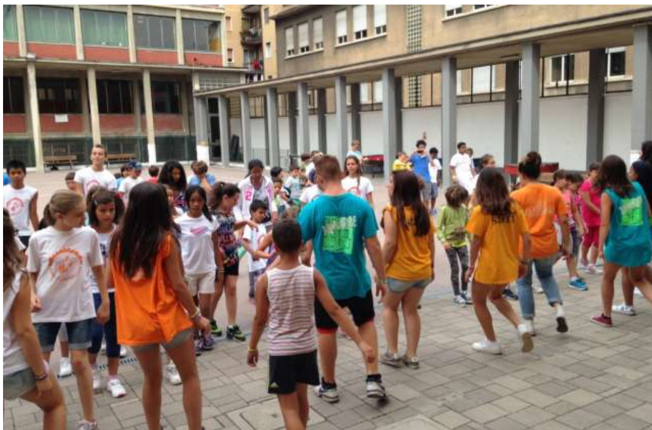
L’Oratorio estivo a San Vito

cammino della fede dei “chiunque”, e per vivere la gioia di trasmettere alle generazioni future la fede ricevuta in dono. Non è una cosa semplice, perché la fede è sempre un dono di Dio, l’opera dello Spirito; è Lui che genera alla fede, ma non lo fa senza di noi, senza la compartecipazione di chi testimonia attraverso la vita, di chi annuncia in parole e opere il Vangelo. Tutto questo in un contesto che vive grandi e inediti cambiamenti. Proveniamo da un tempo nel quale la fede veniva trasmessa anche grazie ad un clima complessivo della cultura-ambiente; un tempo nel quale la parrocchia – e quindi anche il prete che ne era il perno – era al centro del villaggio. Non è più così. I cristiani stanno diventando una minoranza marginale. Ma non è detto che sia un male; come ai tempi di Gesù: un ebreo marginale che annunciava il Vangelo nella “Galilea delle genti”, in un crocevia di culture e di storie che molto somiglia al nostro tempo. Il prete si prende cura della fede “dei chiunque”, di quella fede “dove non te la aspetti”, senza poi aspettarsi che questi cammini di fede si traducano automaticamente in risorse per la comunità. C’è un profilo di gratuità nel suo servizio che gli chiede di restare povero e libero.