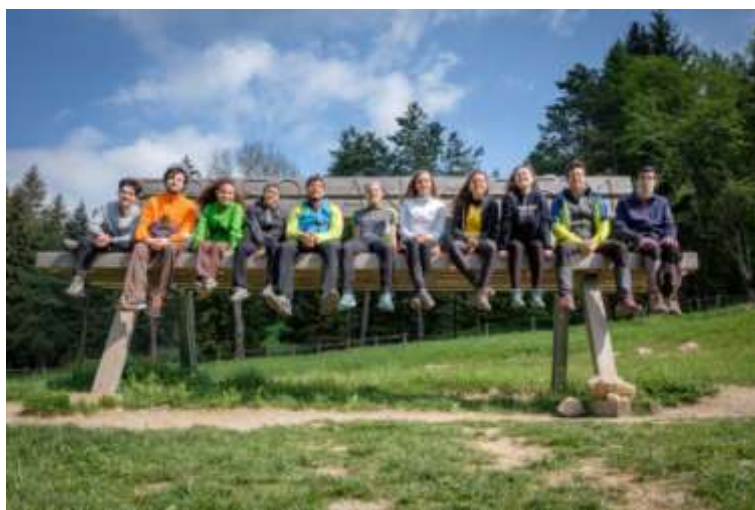
2021 – Bratto, con gruppo giovani