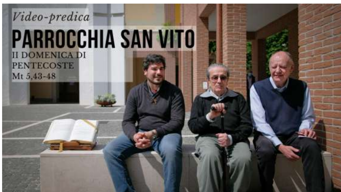
2020 – L'esperienza delle video prediche durante le pandemia