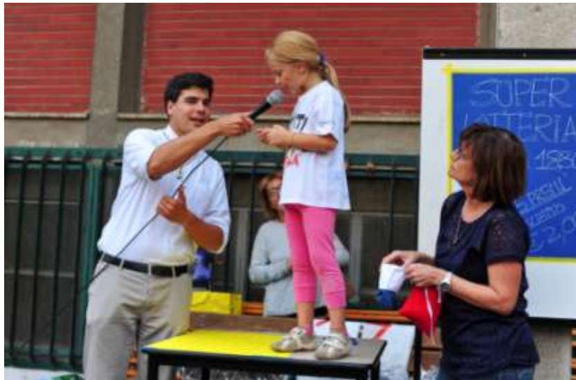
2015 Prime comunioni e festa Oratorio