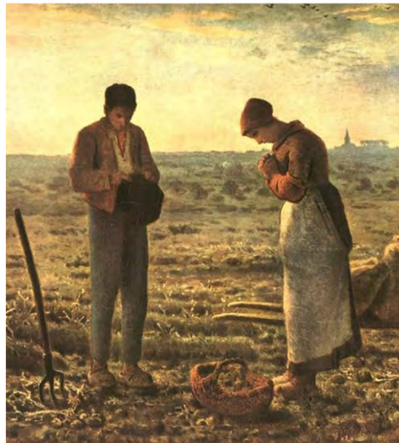
L'Angelus - Jean-Francois Millet - 1857