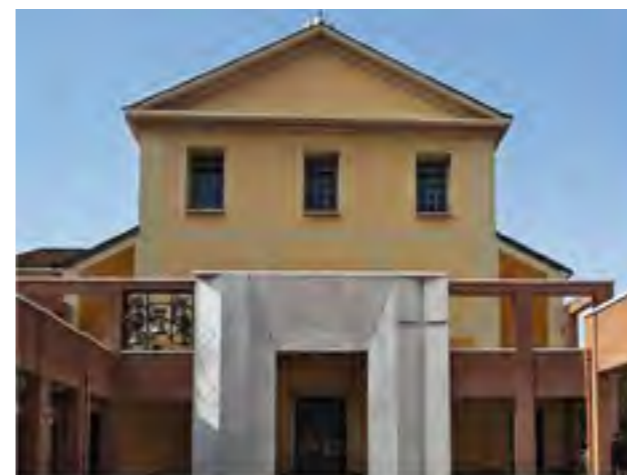
PARROCCHIA SAN VITO AL GIAMBELLINO