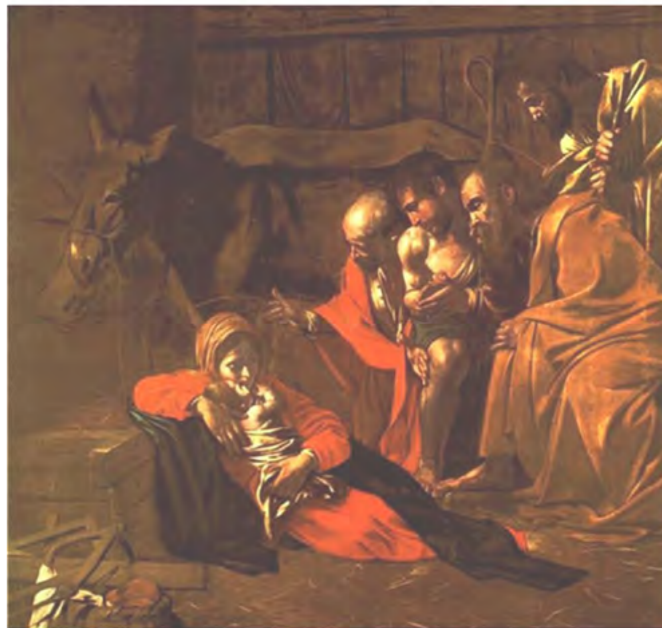
Adorazione dei pastori – Caravaggio - 1609