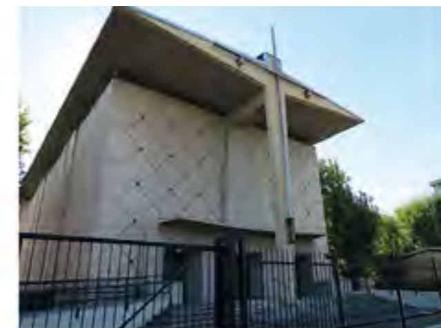
PARROCCHIA SANTO CURATO D'ARS