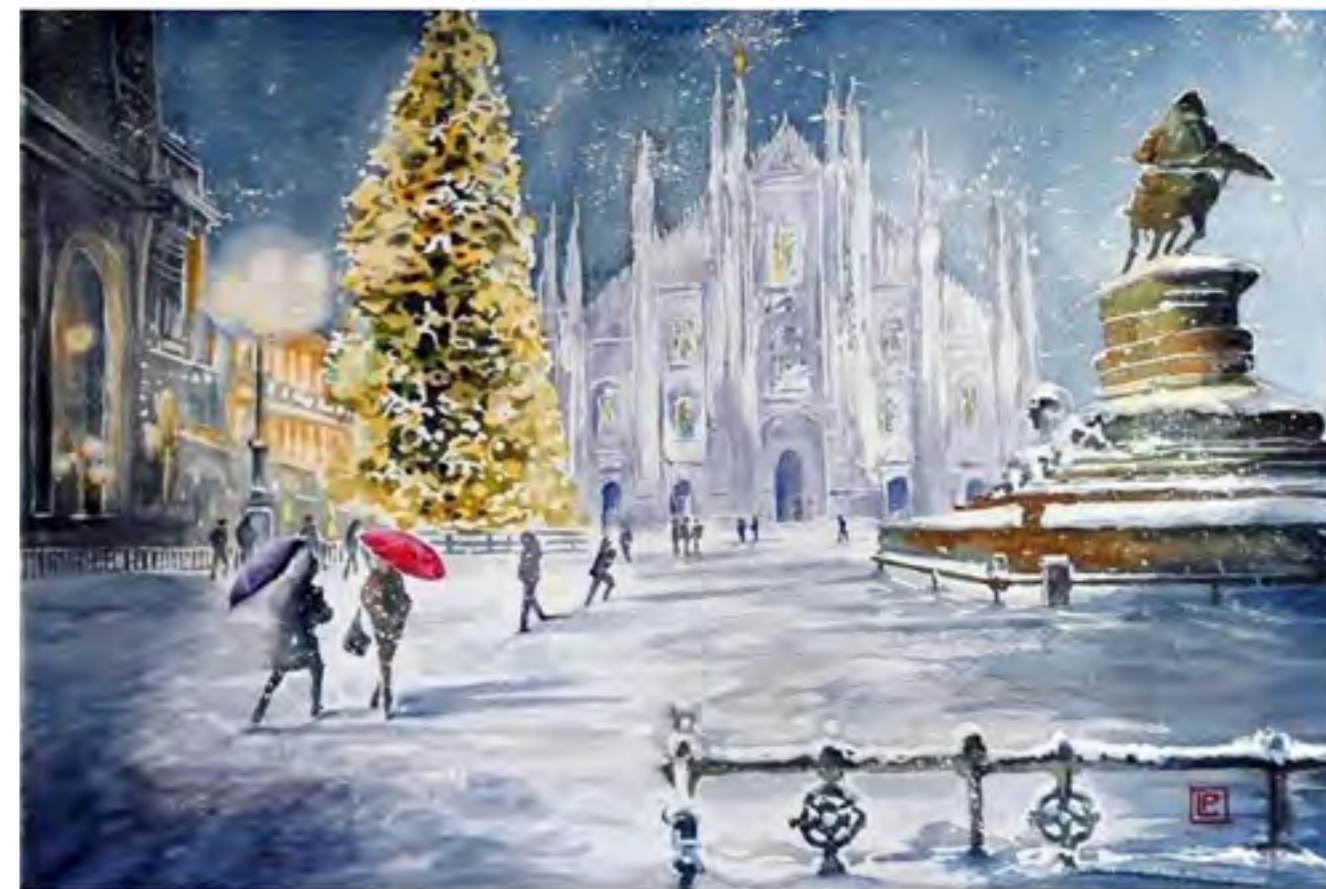
Natale in Duomo a Milano – acquerello di Lorenza Pasquali