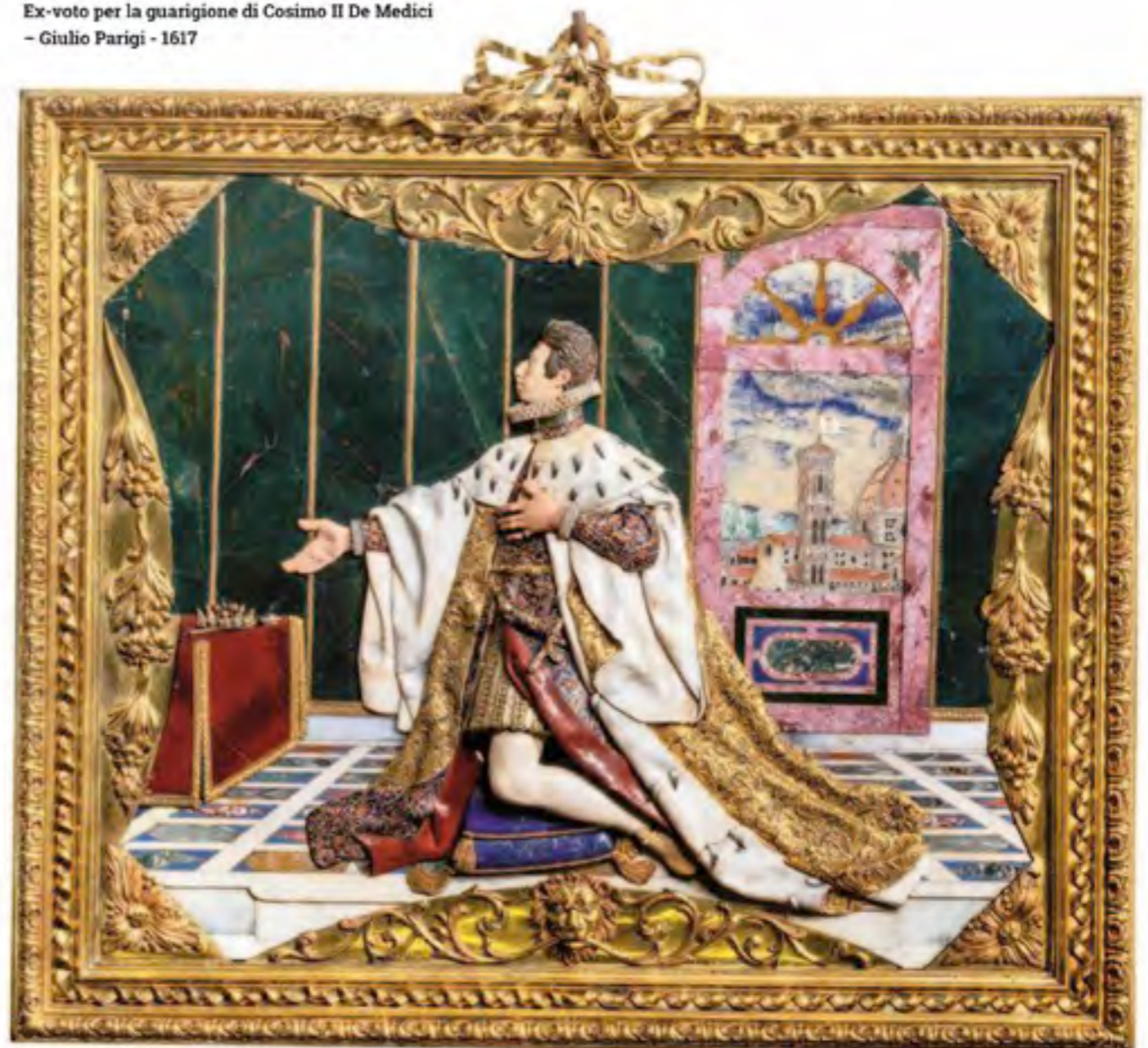
Ex-voto per la guarigione di Cosimo II De Medici - Giulio Parigi - 1617