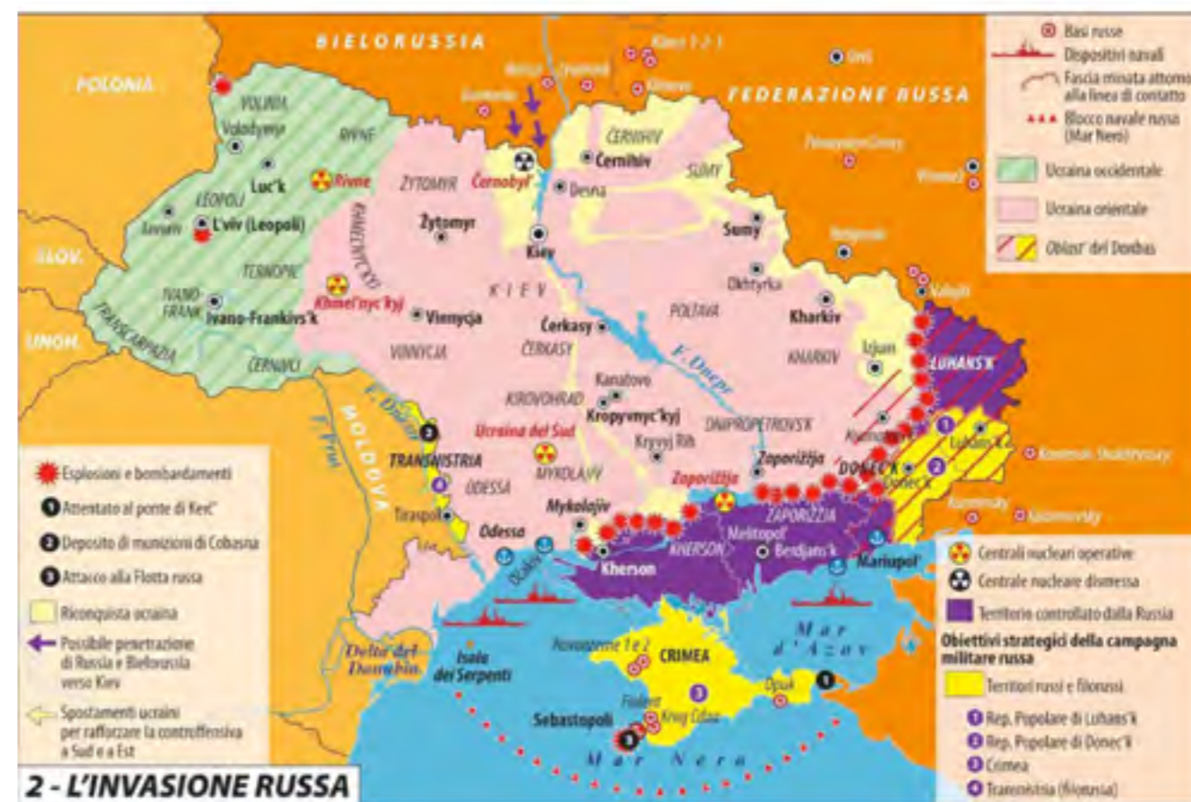
2 - L'INVASIONE RUSSA