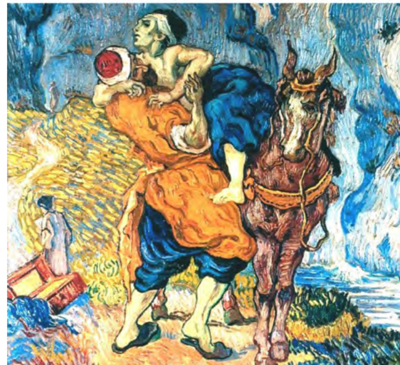
Il buon samaritano - Vincent Van Gogh - 1890