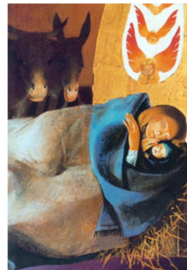
Madonna con bambino – Arcabas - 1970