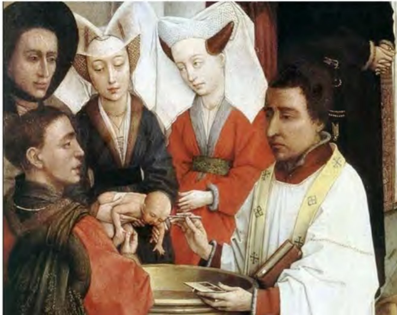
Battesimo nel Medioevo - Rogier Van Der Weyden - 1440