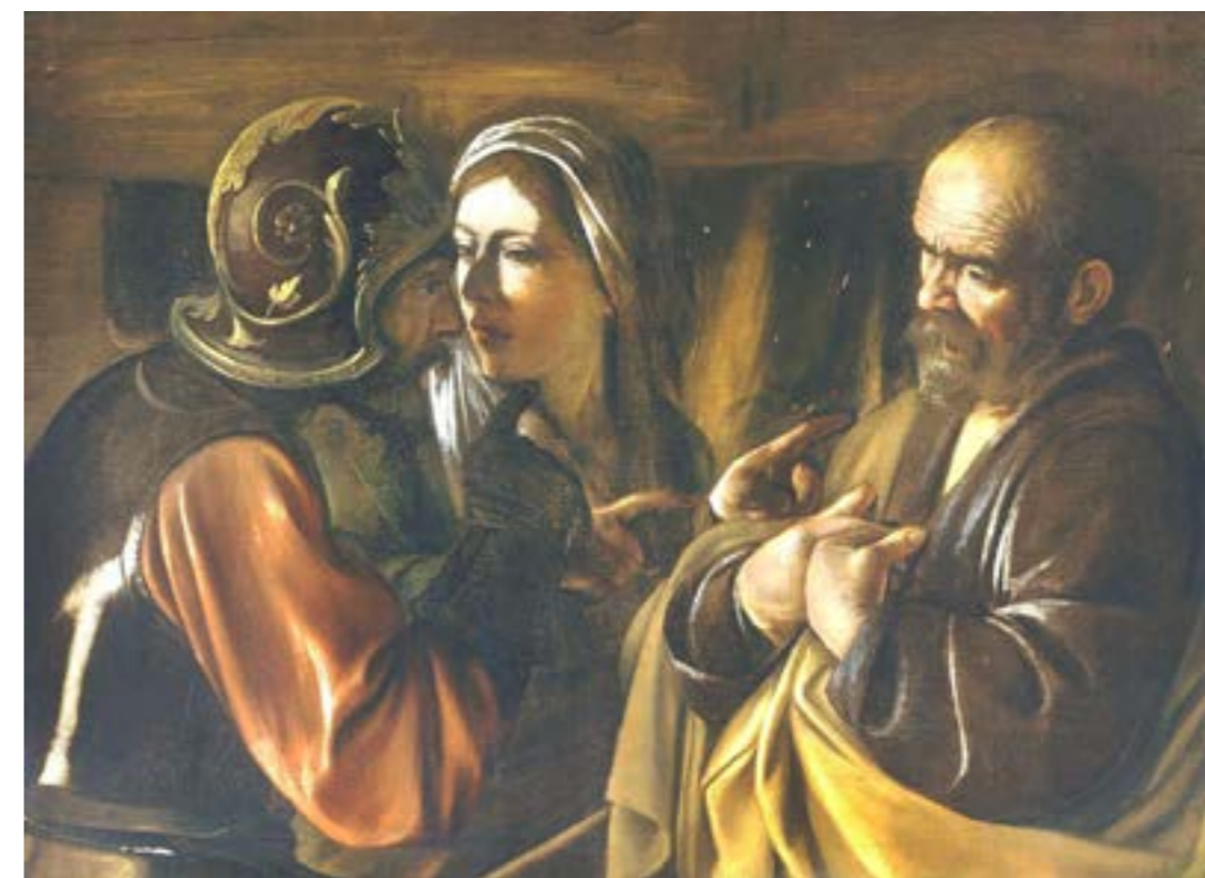
Il rinnegamento di Pietro - Caravaggio - 1610