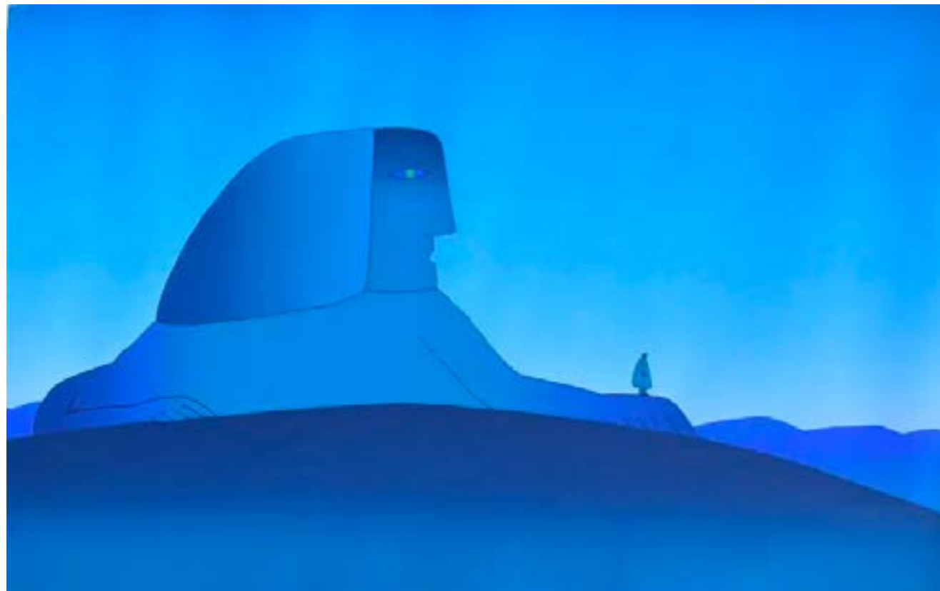
Lignoto – Jean Michel Folon - 1975