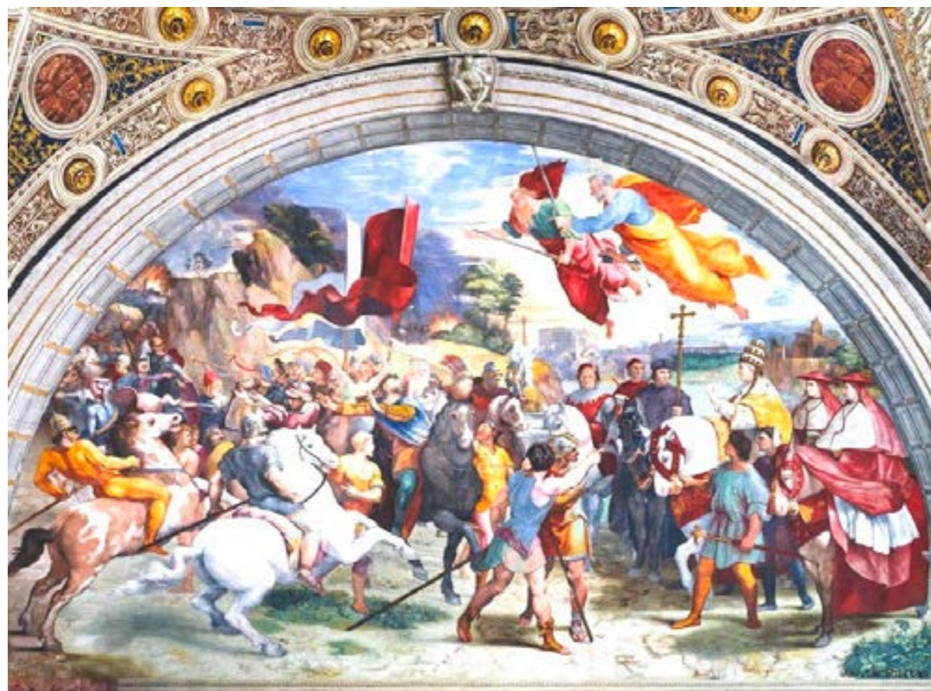
Papa Leone Magno incontra Attila – Raffaello, 1520