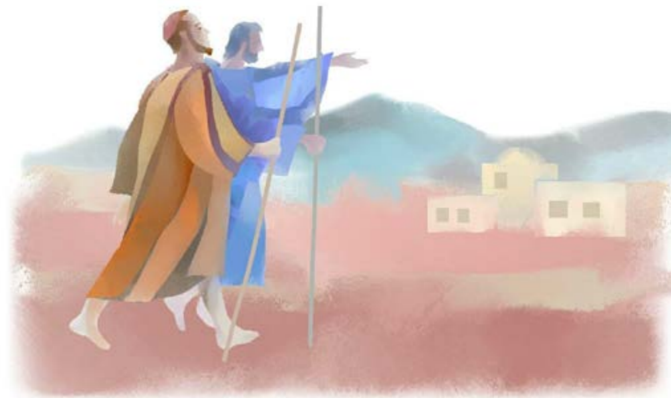
"Poi chiamò a sé i dodici e cominciò a mandarli a due a due..." (Marco 6,7-13)