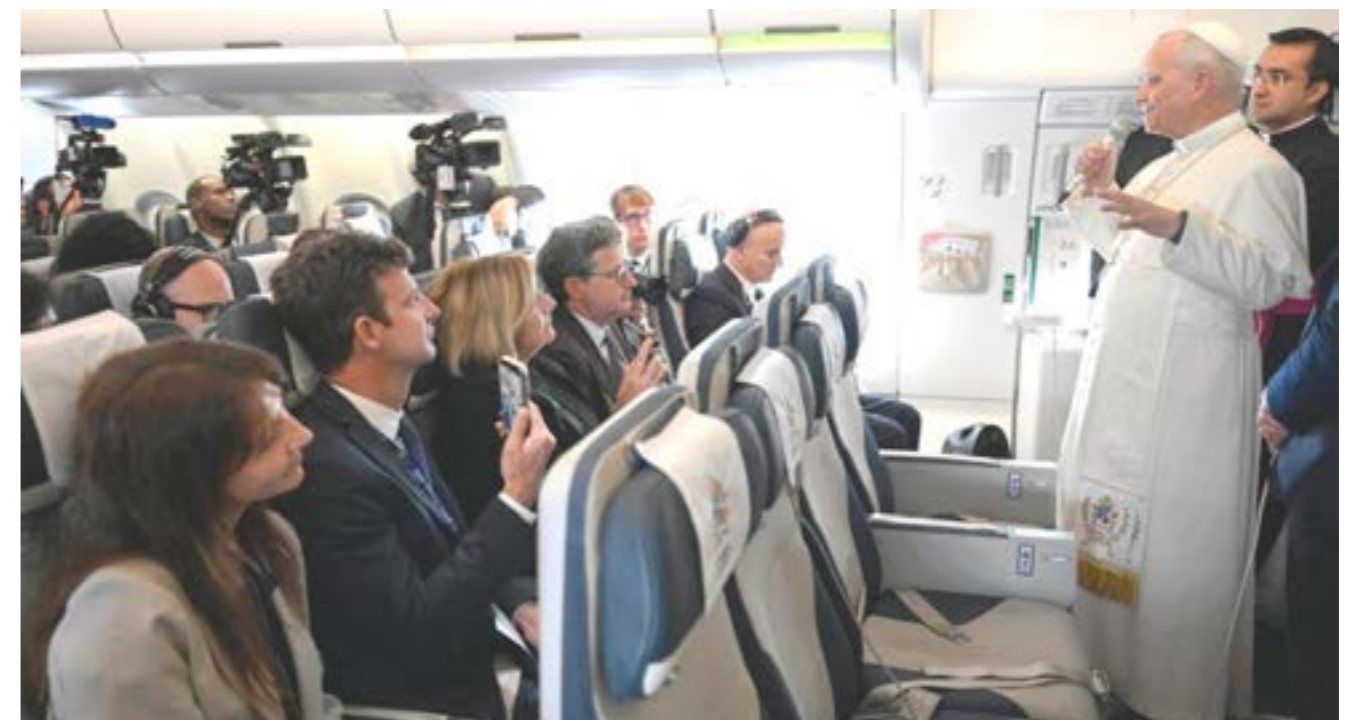
Un momento del dialogo del Papa con i giornalisti sul volo verso l'Africa

«Come ricorda papa Leone, ascoltando il grido di chi soffre, dei più indifesi come i bambini e, anche nella nostra vita quotidiana, non alimentando parole o atteggiamenti ostili nei confronti degli altri. Come cristiani abbiamo un'ulteriore responsabilità: rendere concreti i nostri comportamenti secondo l'insegnamento di Gesù, della Chiesa e del Papa».