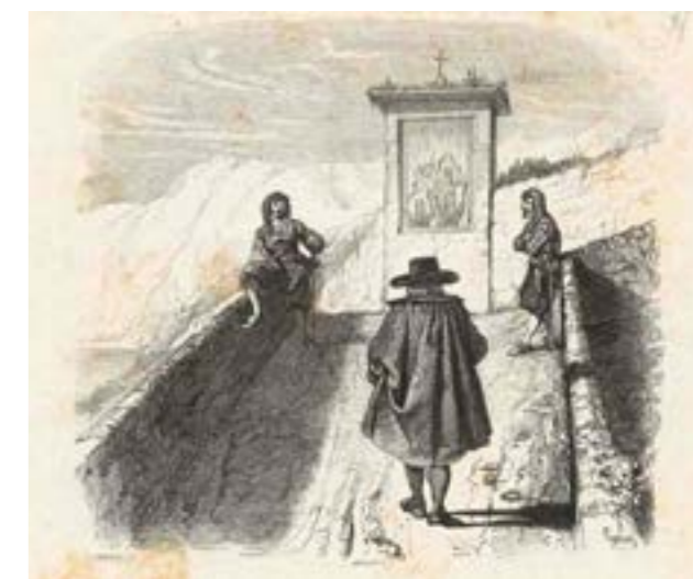
Don Abbondio incontra i bravi. Illustrazione per un'edizione del 1840 dei Promessi Sposi - Biblioteca Braidense