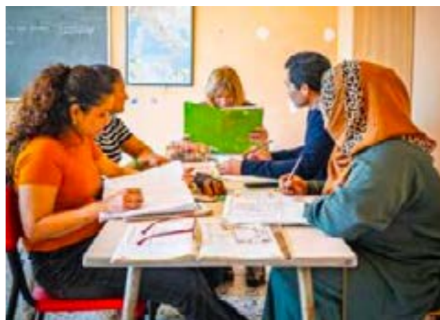
VOLONTARI DELLA SCUOLA DI ITALIANO SAN VITO

Mail: italianoperstranieri.sanvito@gmail.com