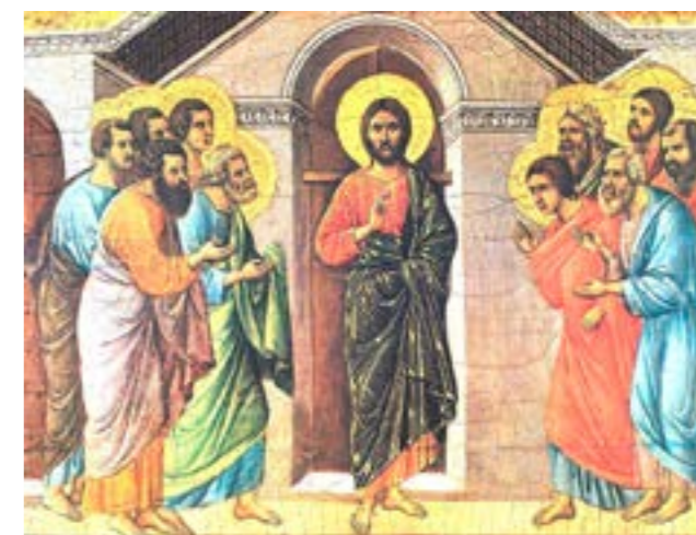
Pace a voi! – Duccio di Buoninsegna - 1308