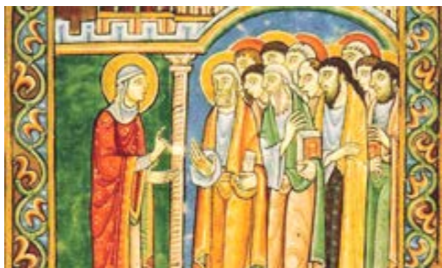
Maria di Magdala annuncia la resurrezione agli apostoli. Da un manoscritto del 1200