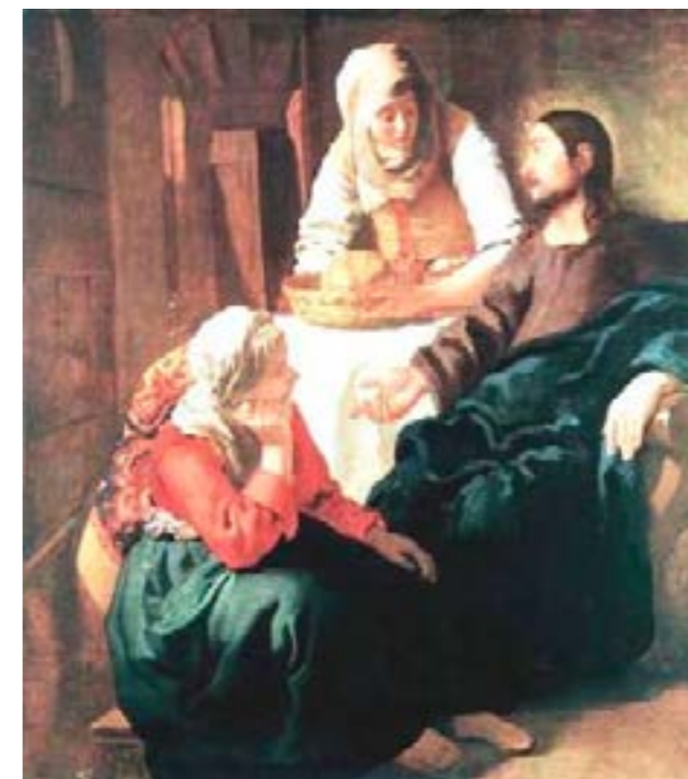
Gesù nella casa di Marta e Maria – Jan Vermeer - 1655

*Iftar è il pasto che interrompe il digiuno nel mese di Ramadan.