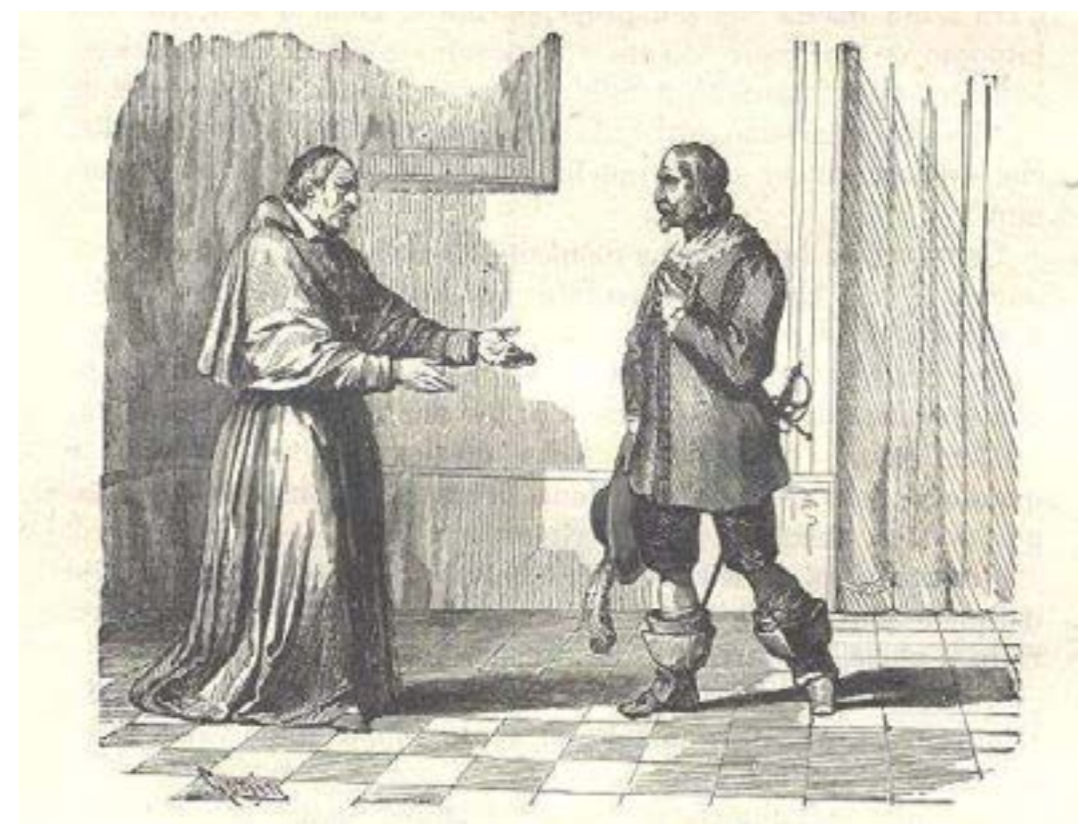
La conversione dell'Innominato. Illustrazione per un'edizione del 1840 dei Promessi Sposi - Biblioteca Braidense/Stanze