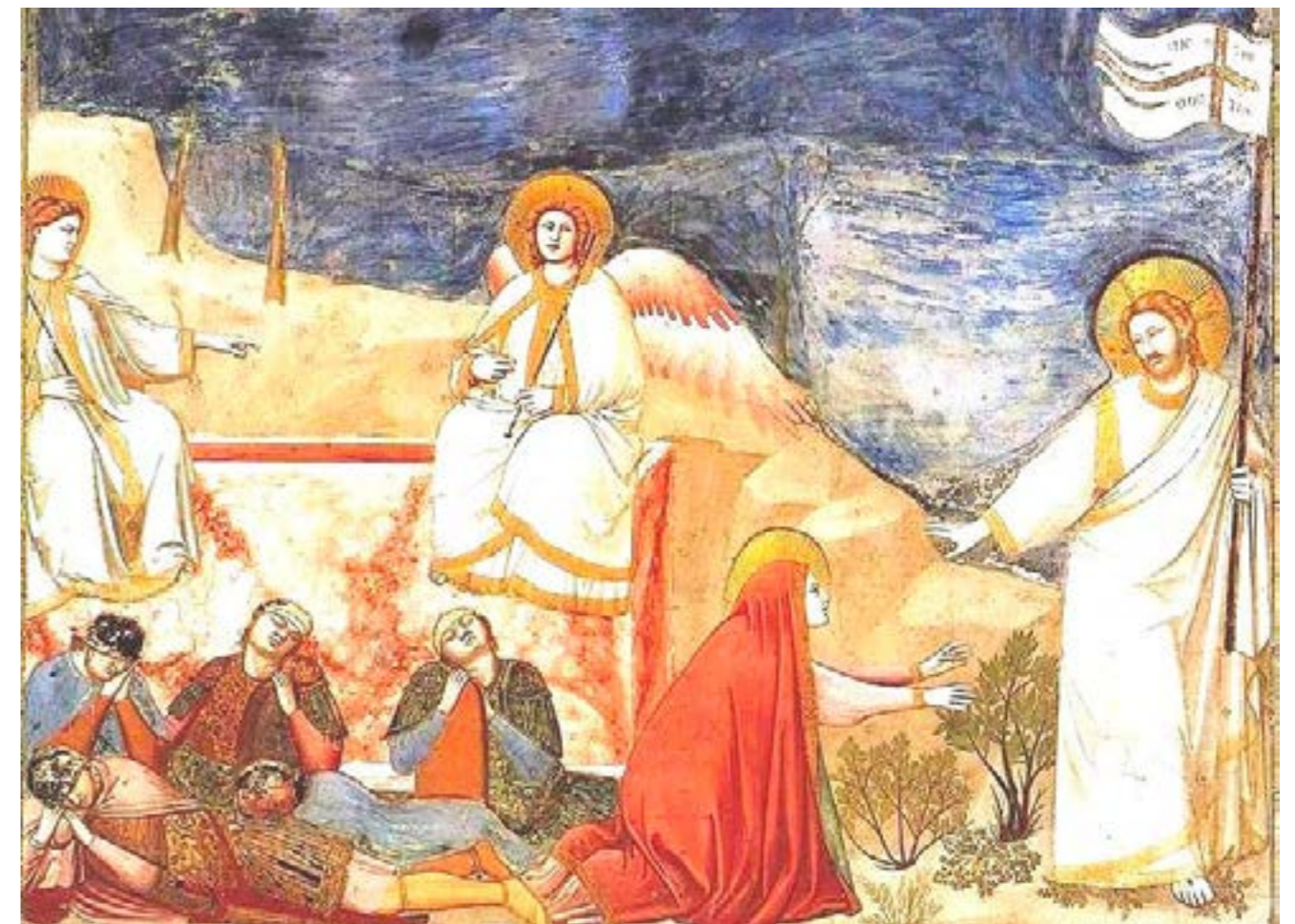
Maria di Magdala e il Risorto – Giotto, 1305 - Cappella degli Scrovegni, Padova