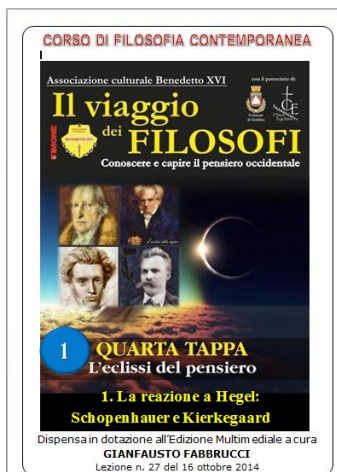
LA RIVOLUZIONE MODERNA