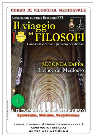
LA LUCE DEL MEDIOEVO